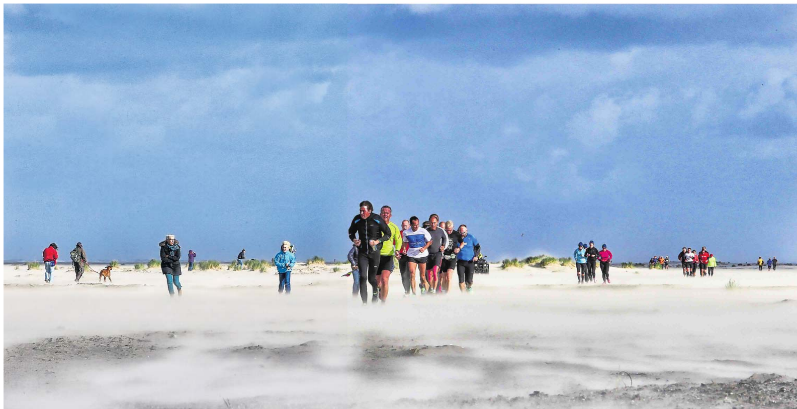
Sfeerbeeld van vorig jaar toen enkele honderden lopers zich ondanks de storm toch op het parcours van de Berenloop waagden.